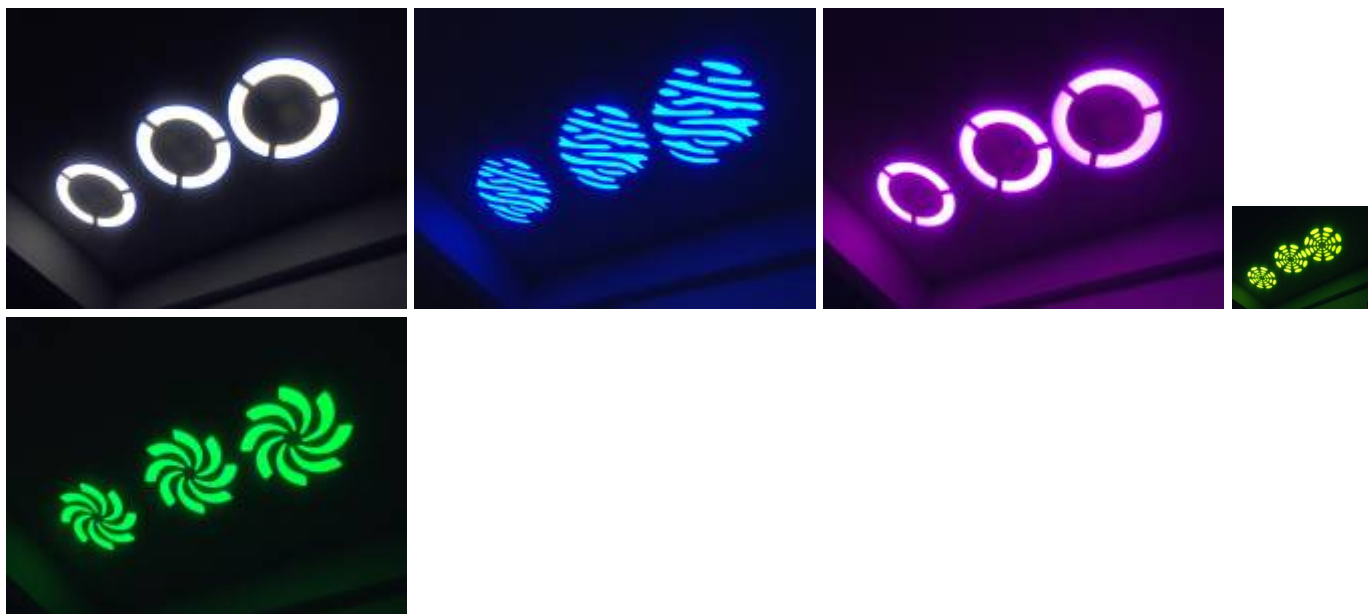
Фото в работе